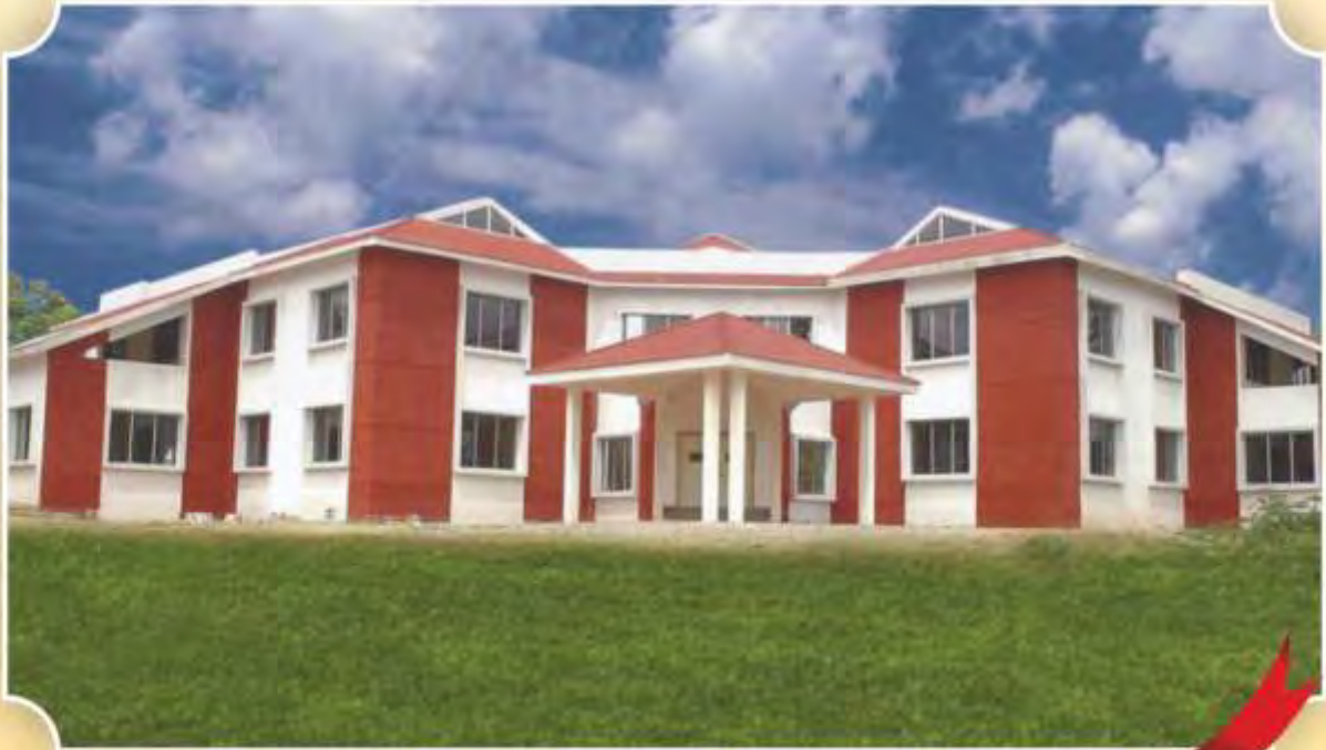
ಕೆಪಿಐಸಿಎಲ್ ಕ್ರೀಡಾ ಸಂಕೀರ್ಣ ಕಟ್ಟಡ, ಹೂಡಿ, ಬೆಂಗಳೂರು