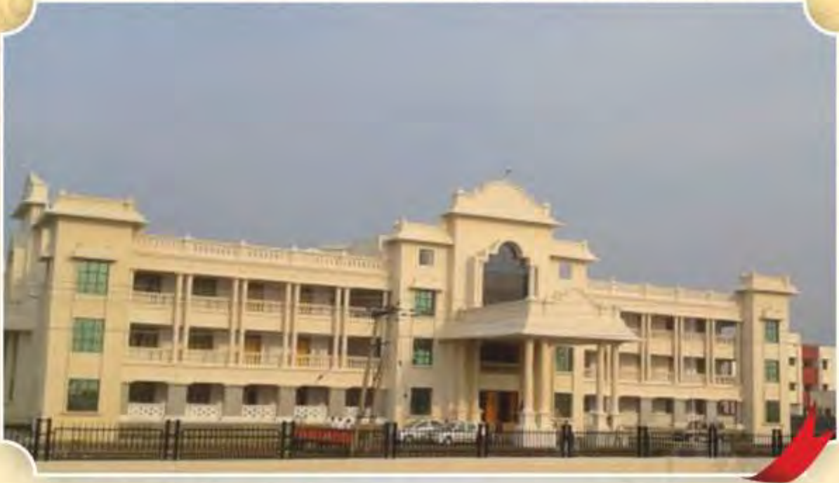
ಜೀವರ್ಗಿಯ ಸಂಯುಕ್ತ ಕ್ಷೇತ್ರಿ ಸಂಕೀರ್ಣ (ಮಿನಿ ವಿಧಾನ ಸೌಧ), ಗುಲ್ಬರ್ಗಾ ಜಿಲ್ಲೆ.