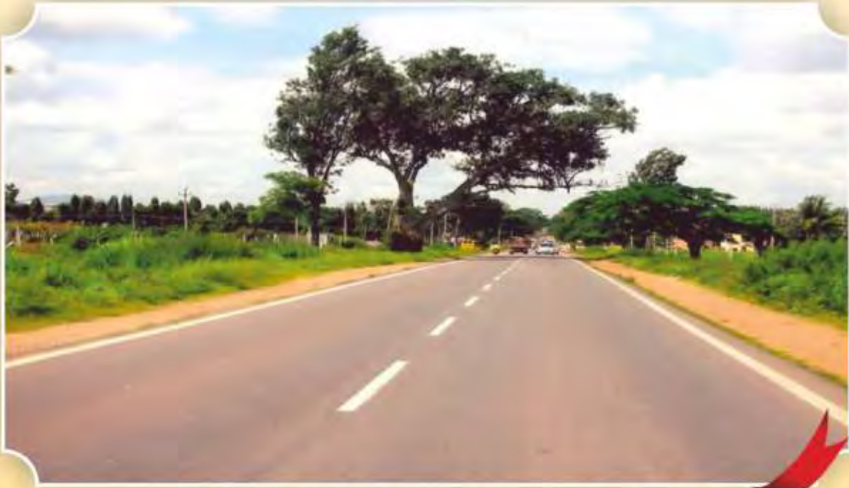
ಬೆಂಗಳೂರಿನಿಂದ- ಚಿಕ್ಕಬಳ್ಳಾಪುರ ರಸ್ತೆಯವರೆಗೆ ಥರ್ಮೋಸ್ಟಾಸ್ಟಿಕ್ ಪೇವಿಂಗ್