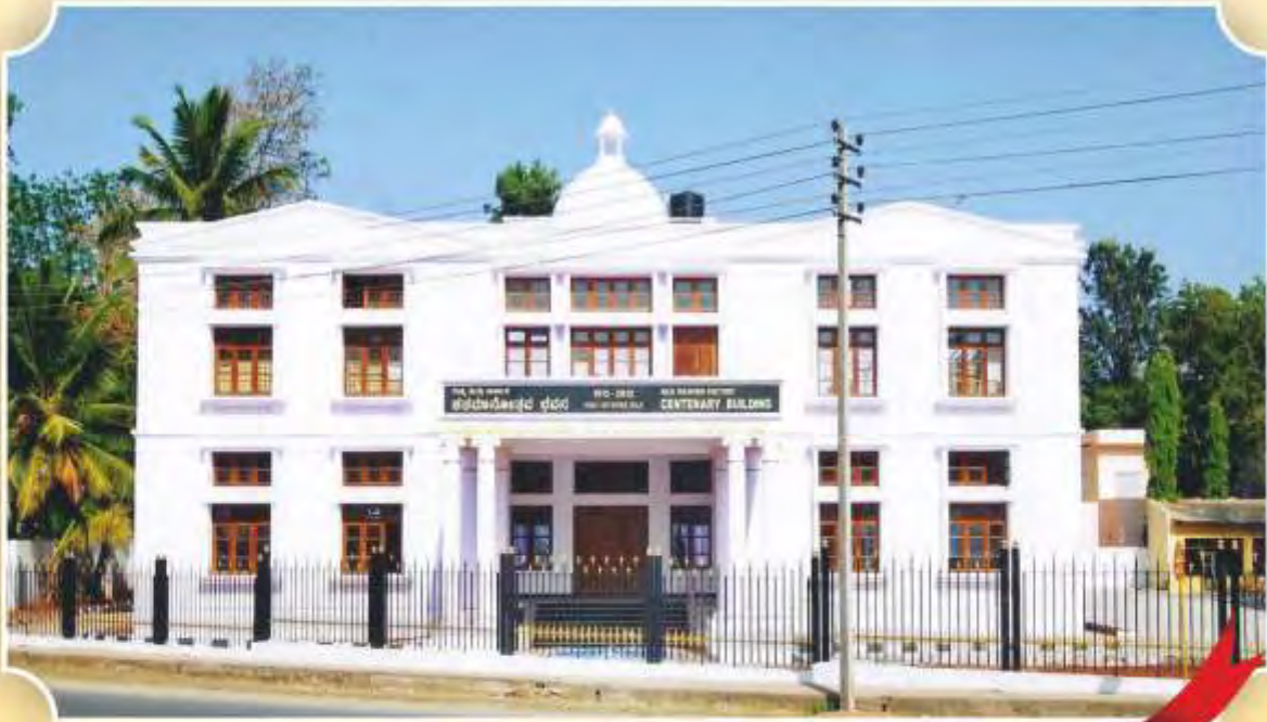
Centenary Building of KSIC at Mysore