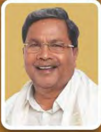
ಶ್ರೀ ಸಿದ್ಧರಾಮಯ್ಯ ಸನ್ಮಾನ್ಯ ಮುಖ್ಯಮಂತ್ರಿಗಳು