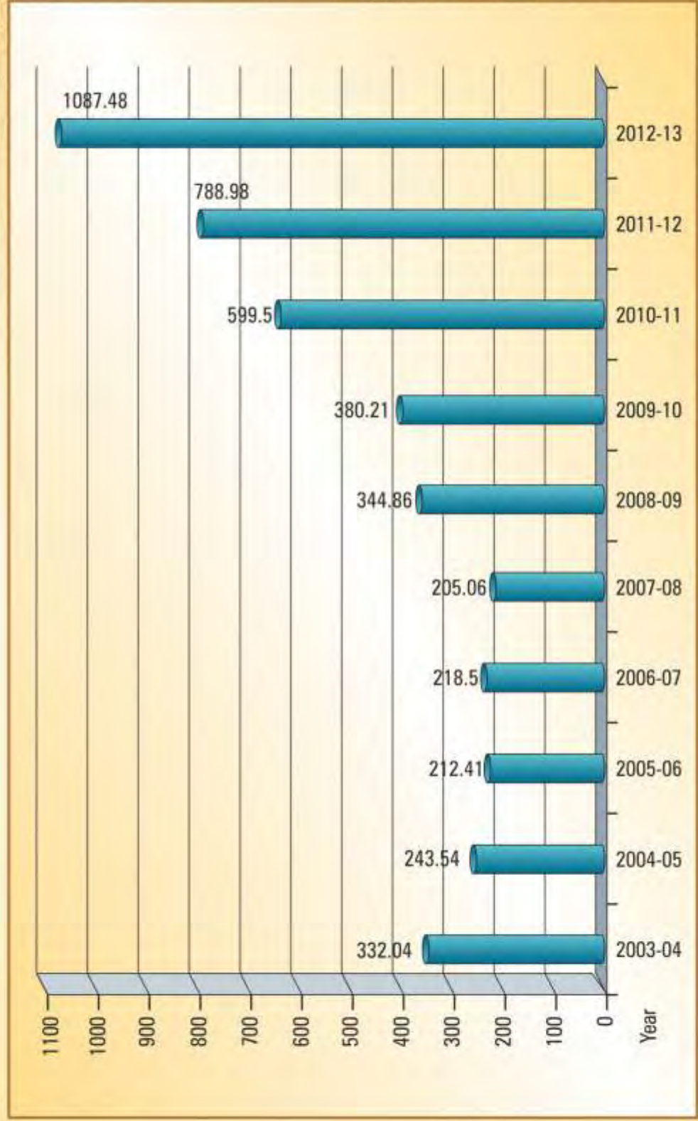
Performance of the Company in the past 10 years Turn Over (Rs. in Crore)

ಕರ್ನಾಟಕ ರೂರಲ್ ಇನ್‌ಫ್ರಾಸ್ಟ್ರಕ್ಚರ್ ಡೆವಲಪ್‌ಮೆಂಟ್ ಲಿಮಿಟೆಡ್, ಬೆಂಗಳೂರು ನಿಗಮವು ಕಳೆದ 10 ವರ್ಷದಿಂದ ಇಲ್ಲಯವರೆಗೆ ಸಾಧಿಸಿದ ಪ್ರಗತಿ (ರೂ. ಕೋಟಿಗಳಲ್ಲಿ)