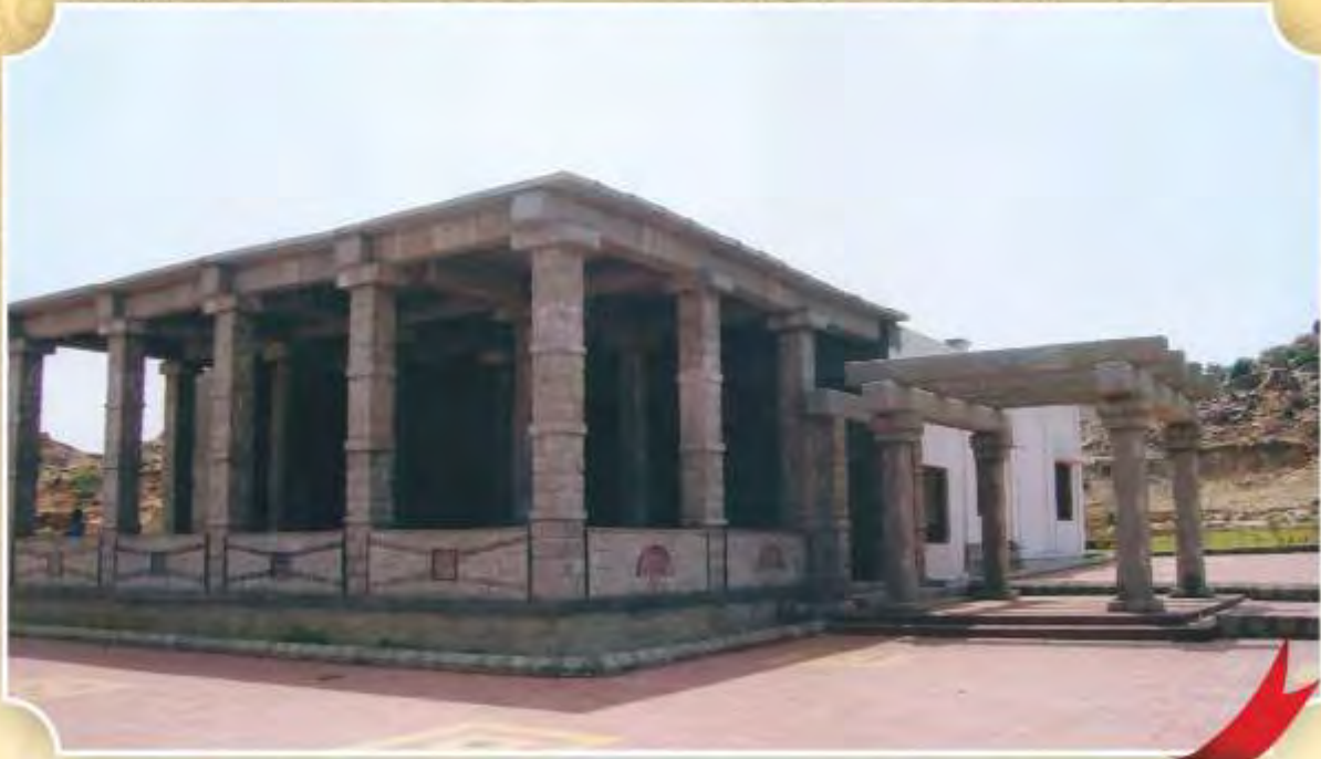
Cafeteria Building at Sanganakallu from Bellary District under Tourism Department