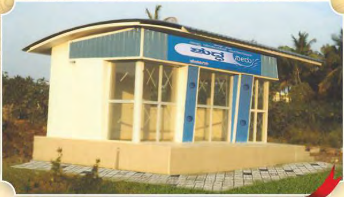
ಶುದ್ಧ ನೀರು ಘಟಕ, ಹೆಚ್. ಗೊಲ್ಲಹಳ್ಳಿ, ಬೆಂಗಳೂರು ದಕ್ಷಿಣ ತಾಲ್ಲೂಕು, ಬೆಂಗಳೂರು ನಗರ ಜಿಲ್ಲೆ