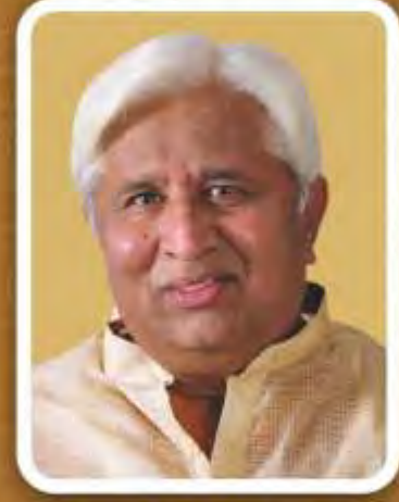
ಶ್ರೀ ಎಚ್.ಕೆ. ಪಾಟೀಲ ಮಾನ್ಯ ಗ್ರಾಮೀಣಾಭಿವೃದ್ಧಿ ಮತ್ತು ಪಂಚಾಯತ್ ರಾಜ್ ಸಚಿವರು