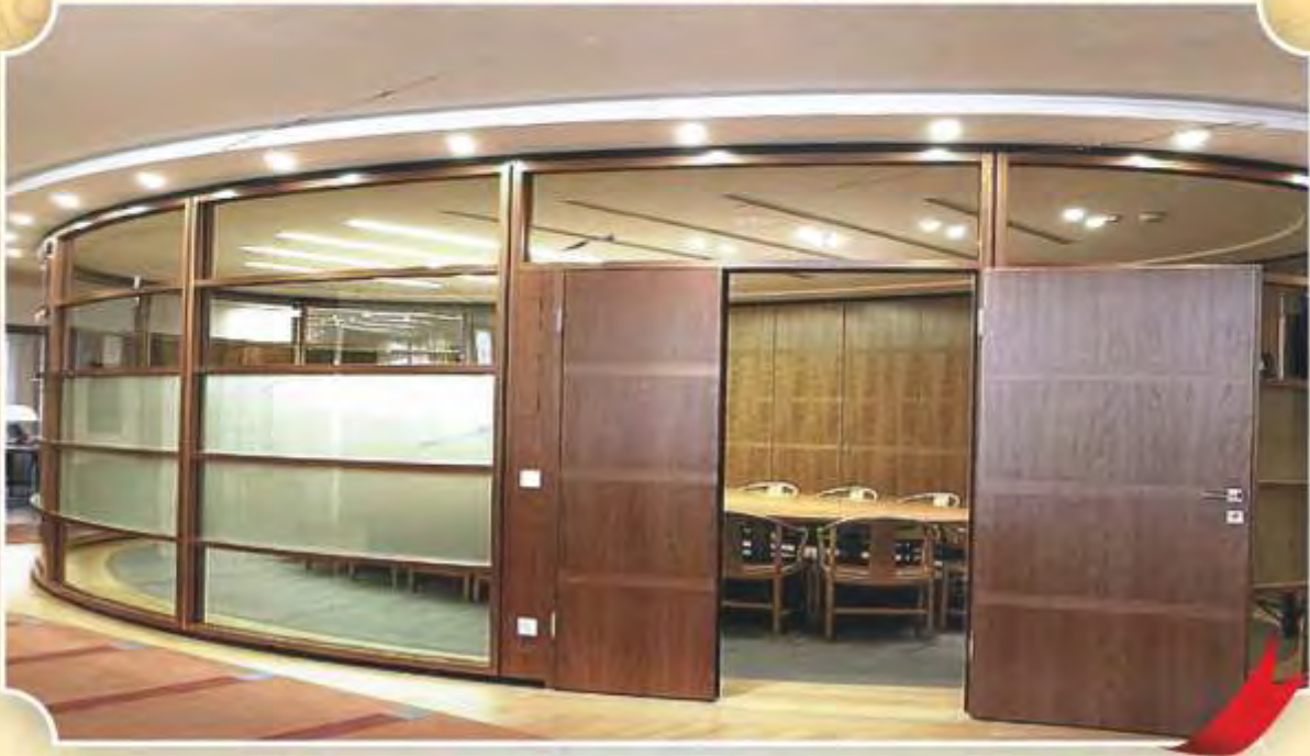
Interior Work to Directorate of Urban Land Transport Office, Shanthinagar, Bangalore