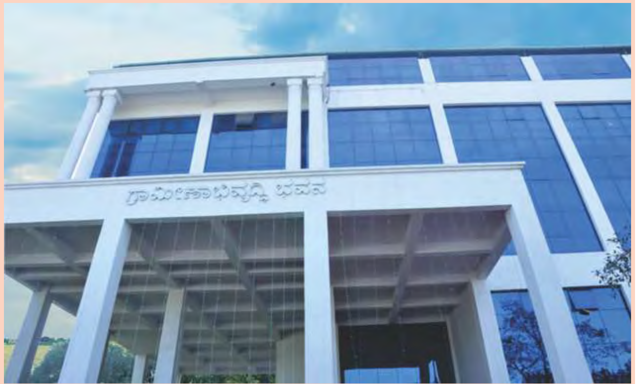
KRIDL Head Office Building