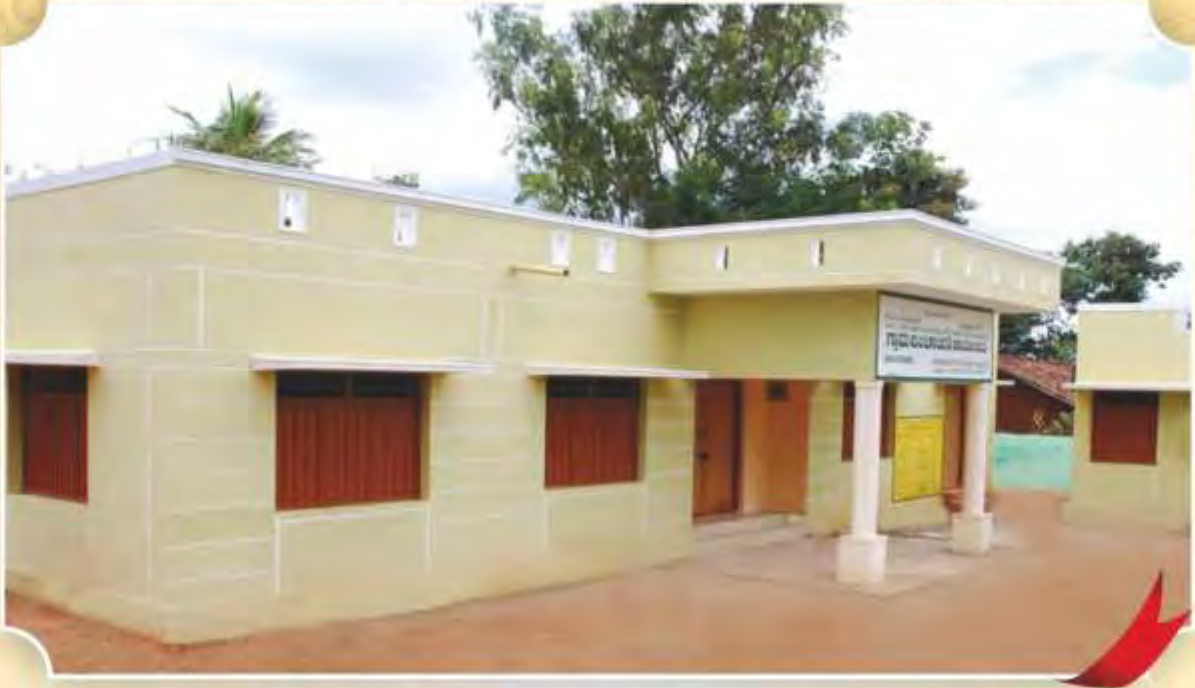
ಅಮಚಾವದಿಯ ಗ್ರಾಮ ಪಂಚಾಯಿತಿ ಕಟ್ಟಡ ಮತ್ತು ಮಾಹಿತಿ ಕೇಂದ್ರ, ಚಾಮರಾಜನಗರ ತಾಲ್ಲೂಕು