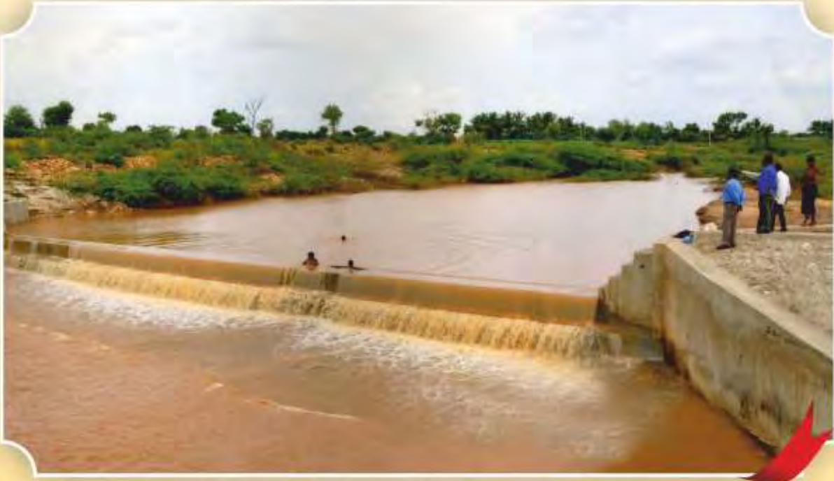
ಡಾ|| ಡಿ.ಎಂ. ನಂಜುಂಡಪ್ಪನವರ ವರದಿ ಆಧಾರಿತ ಅತಿ ಹಿಂದುಳಿದ ಕೂಡ್ಲಿಗಿ ತಾಲ್ಲೂಕಿನ ಹುಡೇಂ ಗ್ರಾಮದ ಕುಡಿಯುವ ನೀರು ಸರಬರಾಜು ಯೋಜನೆ