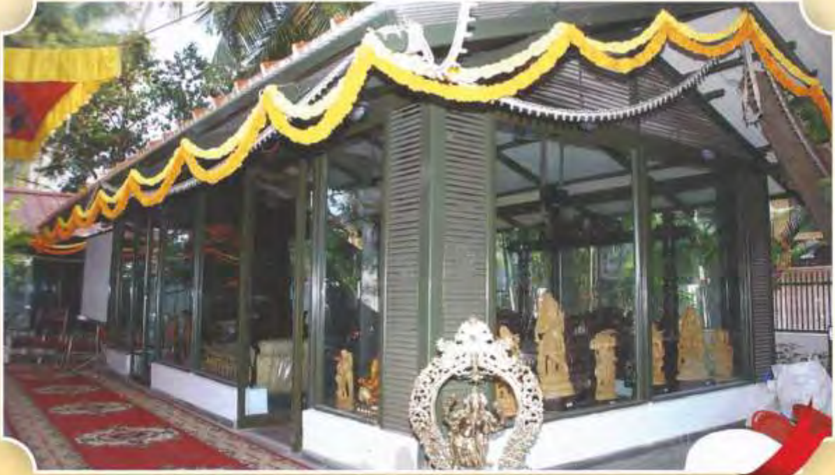
ಜಯನಗರದ ಕಾವೇರಿ ಎಂಪೋರಿಯಂನ ಒಳಾಂಗಣ ಕಾಮಗಾರಿ, ಬೆಂಗಳೂರು.