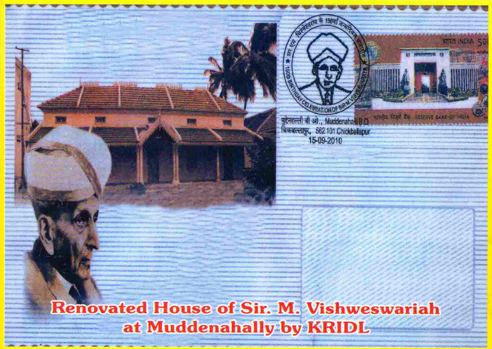
Renovated House of Sir. M. Vishweswariah at Muddenahally by KRIDL

36 ನೇ ವಾರ್ಷಿಕ ವರದಿ 2009-2010 36th ANNUAL REPORT 2009-2010